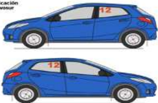
Instalación y Ubicación Números Rally Avosur